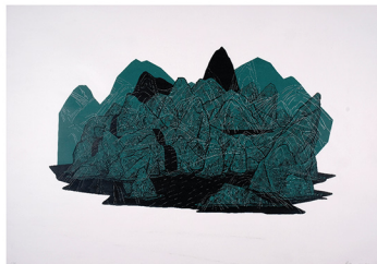
Ilya Yerashevich, Invisible, serigrafia, 2018

Od 2014 roku Ostrawska Katedra Grafiki, nawiązując do programu sympozjów serigraficznych SWO /Serigrafia Workshop Ostrava 1997–2001/, powołała w nowym formacie Międzynarodowe Sympozjum Serigraficzne w Ostrawie /International Symposium Serigrafie Ostrava/ ISSO, w ramach którego odbywają się cykle międzynarodowych spotkań grafików i pedagogów z artystycznych szkół wyższych.